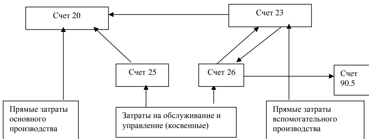
Рисунок 6 – Взаимосвязь счетов производственных затрат

Взаимосвязь счетов производственных затрат можно представить в виде следующей схемы, представленной на рисунке 6.